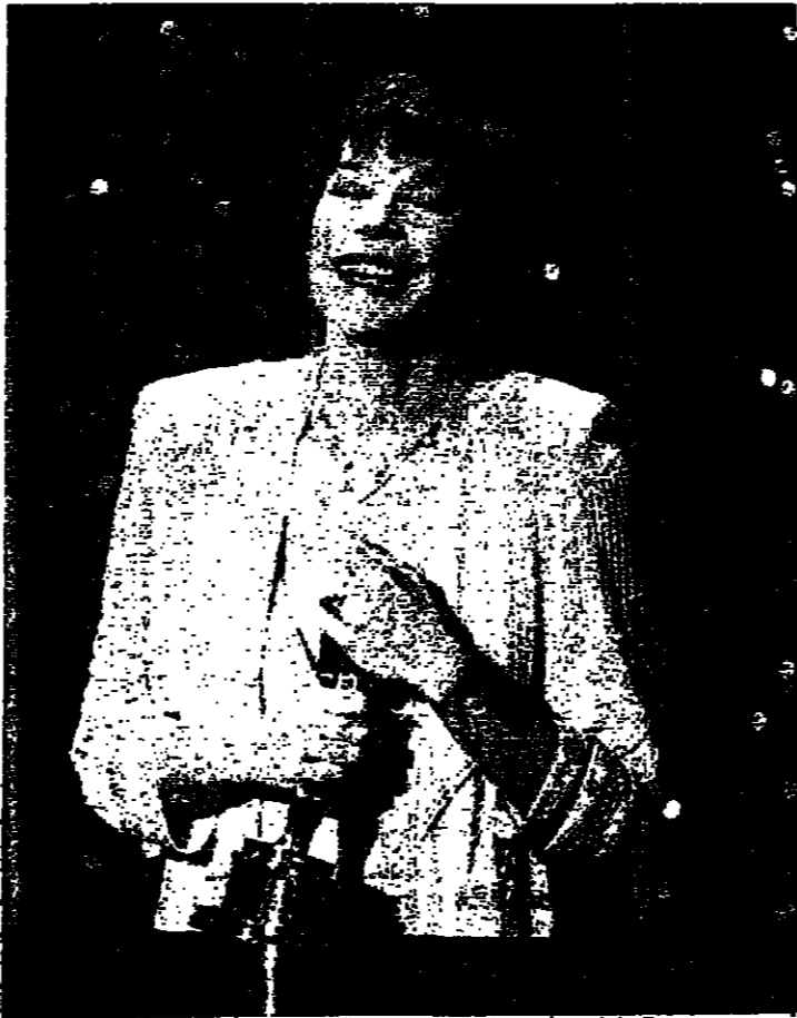
شيرلي مكليين تضم الأوسكار الى صديها بمنتهى السعادة